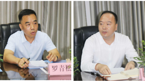
市总工会党组成员、副主席罗青松讲话 县委副书记、统战部长、县总工会主席冯海燕讲话

【本报讯】9月3日，通城县研磨行业职工(劳模、工匠)创新工作室联盟正式成立，联盟由通城县研磨行业协会会长单位湖北玉立砂带集团发起，携10家通城县研磨行业协会副会长和监事长单位共同组建。咸宁市总工会党组成员、副主席罗青松，通城县县委副书记、统战部长、县总工会主席冯海燕出席联盟成立仪式并讲话。通城县总工会党