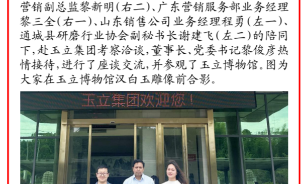
玉立集团欢迎您的到来