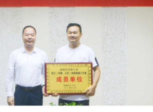
通城县研磨行业(劳模、工匠)创新工作室联盟成员合影