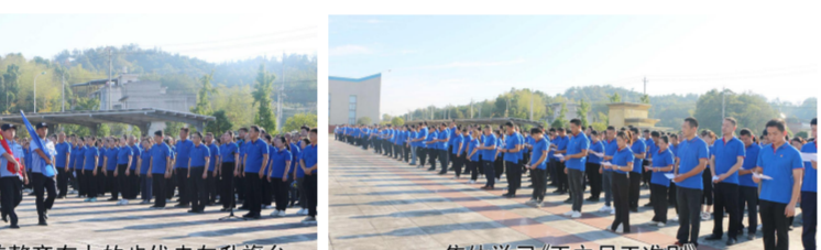
国旗护卫队迈着整齐有力的步伐走向升旗台