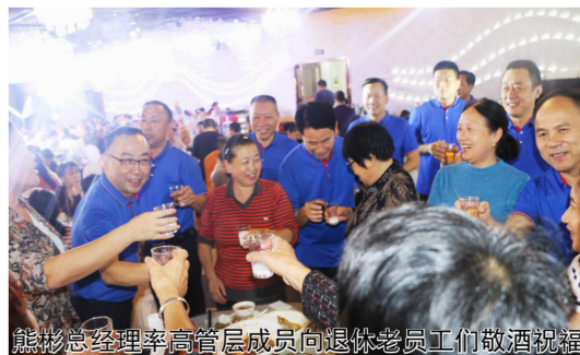
熊彬总经理率高管层成员向退休老员工们敬酒祝福