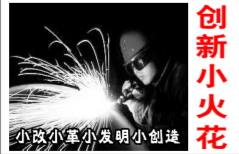
小小美纹纸发明小火花

以前织布车间领取棉纺车间生产的气流纺筒子纱，虽然是按生产先后顺序使用，但是在使用过程中，如有质量问题无法追溯到生产日期，车间甚是苦恼。为此车间想了很多办法，怎么能将生产日期标识在棉纱上，便于查找生产日期进行质量追溯呢？开始想用粉笔画，可是粉笔画的容易模糊不清，后来又想用标签贴在胶管内侧，可是织布用完退管后，棉纺车间需要安排员工撕掉旧标签，而且标签上的不干胶有时撕不掉，会粘附在管子上，时间久了管子内侧就会粘满不干胶。考虑到这个问题，有什么办法能将生产日期标签贴在棉纱上不易脱落，还没有胶粘棉纱呢？想来想去，美纹纸不是有这个特性吗？于是，车间请来美纹纸，在美纹纸上注明机台号、生产日期、班次号，然后落纱时贴在棉纱上，织布领纱后根据美纹纸标签做好记录，生产过程中有任何疑问，就直接可以查到棉纱生产日期，利于棉纱质量追溯，解决了困扰大家多年的一个难题。所以说，小小美纹纸，发挥大作用。